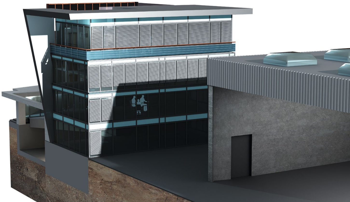
Sonnenschutzfunktionen: Thermoautomatik und Verschattung

Raumautomation und den Primäranlagen automatisch an. Auf diese Weise kann der Energieverbrauch der Ventilatoren um bis zu 45 % verringert werden. Präsenzzabhängig wird der Volumenstrom bei Abwesenheit auf ein Minimum reduziert.