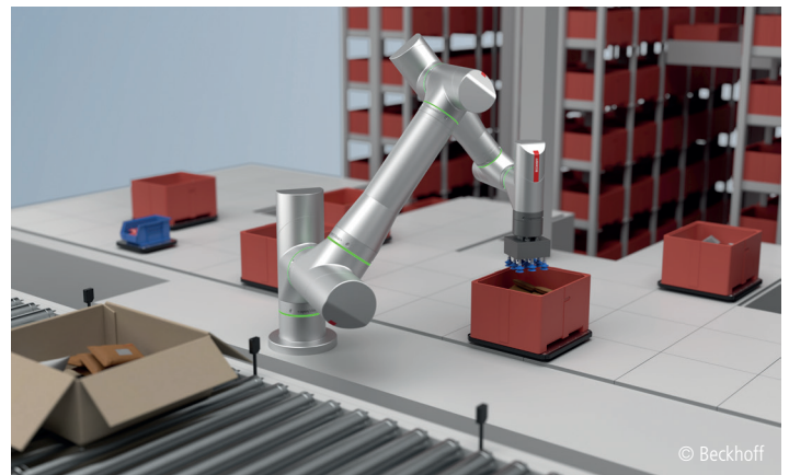
Der modulare Industrieroboter-Baukasten ATRO vereinfacht das Handling in Intralogistik und Produktion.

Roboterarm geleitet, dass dieser in jede Achse endlos drehen kann. Dadurch entfallen störende außenliegende Kabelführungen, die die Reichweite des Roboterarms begrenzen. Der vielleicht größte Vorteil des ATRO-Systems ist, dass es vollständig in die TwinCAT-Steuerungsarchitektur integriert ist. Es wird also keine separate Robotersteuerung benötigt. Die mobile Robotersteuerung von Beckhoff übernimmt auch die Steuerung der ATRO-Kinematik. ATRO eröffnet neue Möglichkeiten für mobile Roboter mit zusätzlichen Roboterarmen, die die von vielen Endanwendern im Einzelhandel und Paketdienst geforderte Flexibilität ermöglichen.